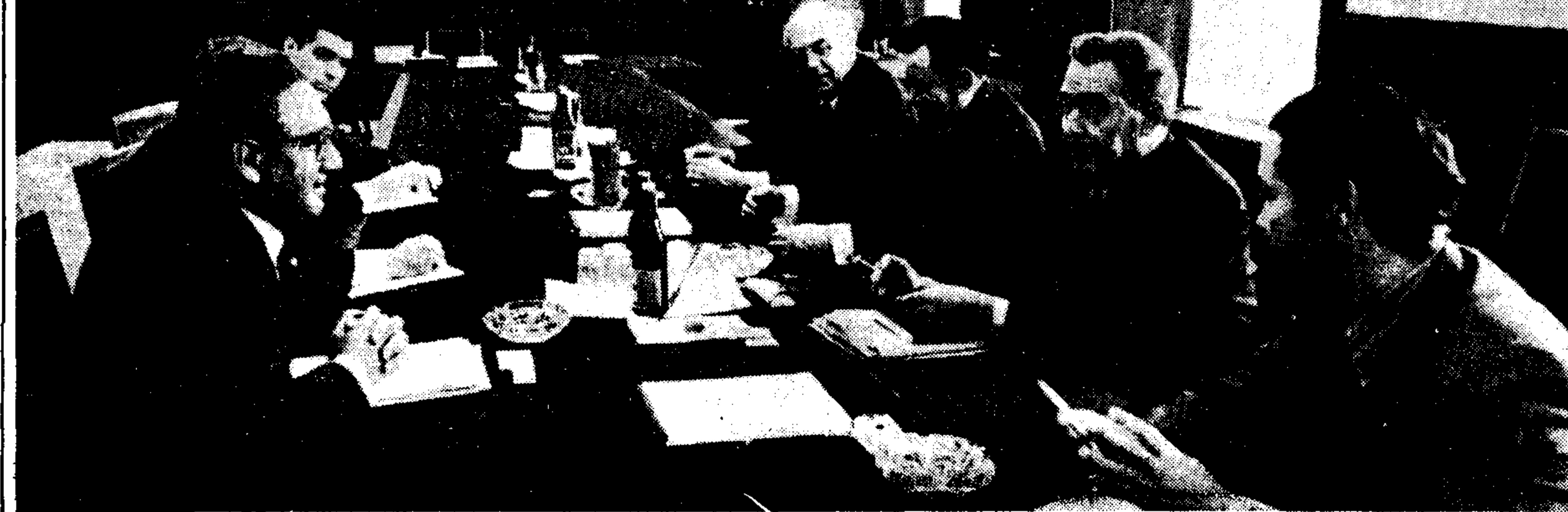
Από τις εξαιρετικά καρποφόρες συνομιλίες του ειδικού απεσταλμένου του προέδρου Νίξον στη Μόσχα...